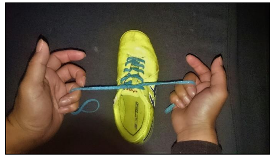
②写真のように持つ