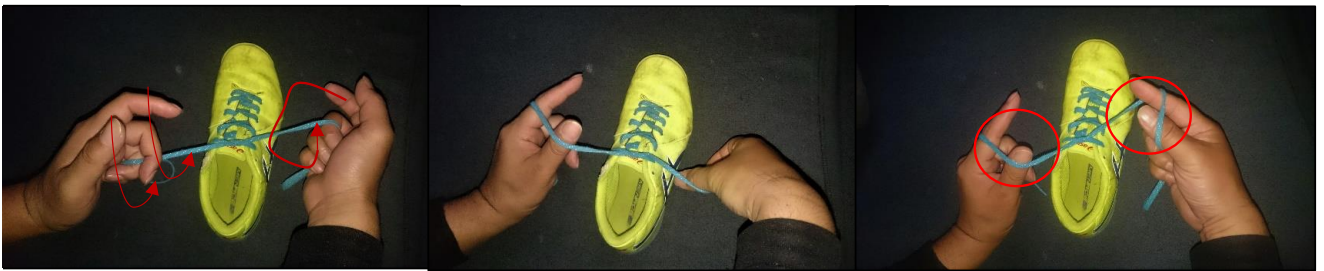
③下クロス側をヒモの下を廻して 人差し指、親指の順番でひっかける