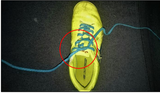
①蝶々結び同様にヒモを一回転クロスさせる 写真は左ヒモが下クロスです