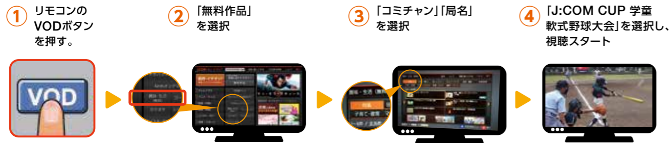
J:COM オン デマンドトップ画面イメージ

第9回 J:COM CUP 学童軟式野球大会 2017 2018年3月 無料配信予定